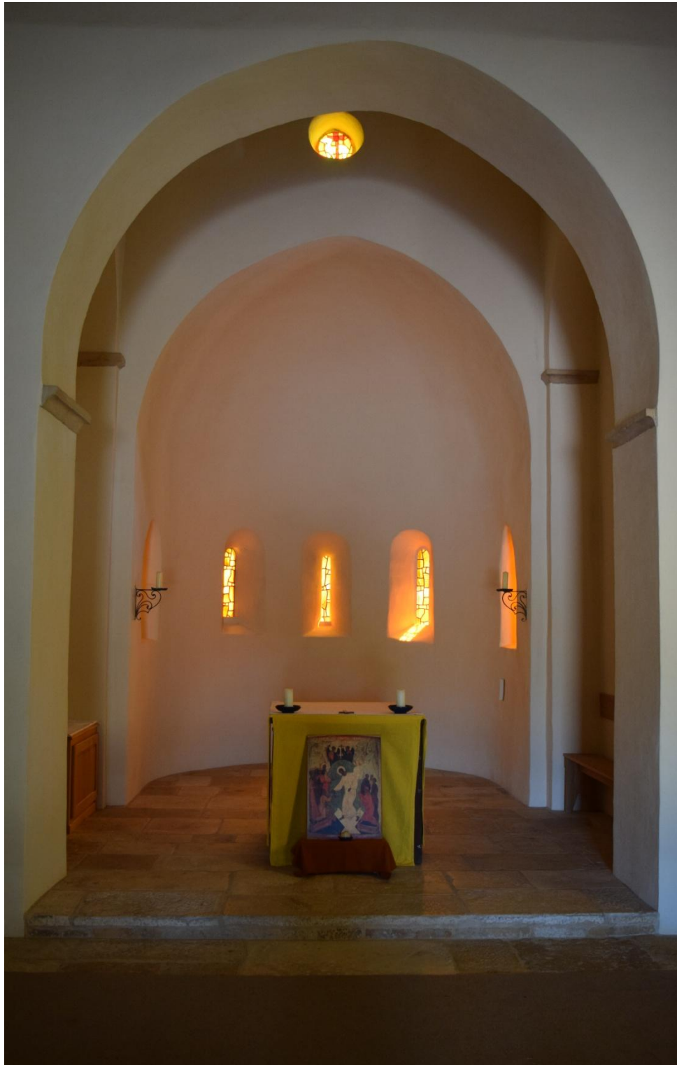
Altarraum der (alten) Kirche in Taizé

Evangelisch-Lutherische Landeskirche Sachsens